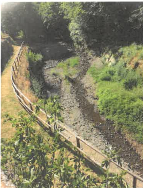
Figura 3 Resco dopo il punto di prelievo