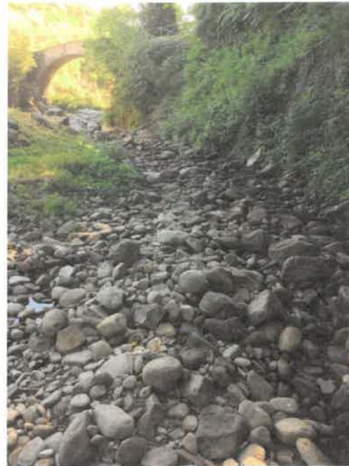
Figura 1 Resco dopo il punto di prelievo