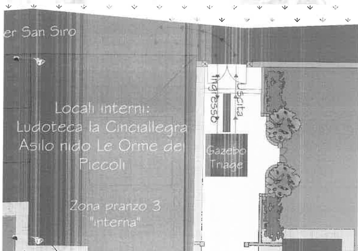
Figura 1: Gazebo Triage

Al momento che tutti i bambini sono arrivati al centro estivo, il cancello verrà chiuso e riaperto solo al momento dell'uscita.