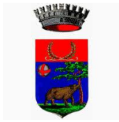
Comune di Reggello