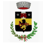
Comune di Pelago