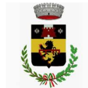
Comune di Pelago