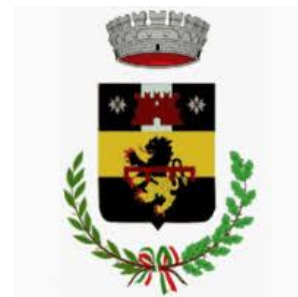
Comune di Pelago