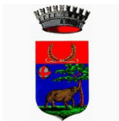
Comune di Reggello