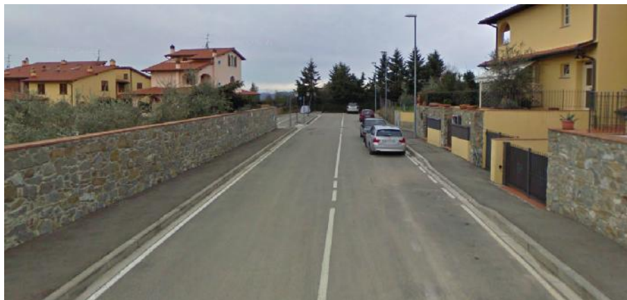
Via P. Della Francesca

Tratto esistente Via P. della Francesca) su questa fognatura esistente, non sono previsti interventi, tranne la realizzazione di un nuovo pozzetto per rialzare l'uscita della fognatura dal pozzetto 3 che attualmente devia le acque dalla condotta DN500 che va verso la rotatoria alla fognatura posta sulla vicinale di S. Teà, trasformando questo tratto in uno scolmatore. Si prevede inoltre di trasformare il tratto interno al comparto PRI-11 in scolmatore tramite la parziale chiusura a monte della Fognatura DN300 come meglio indicato nella tavola IDR-002.