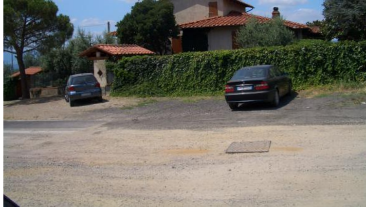
Foto pozzetto 6 esistente su tratta A

Tratta A) Le caditoie stradali del tratto di strada iniziale che collega la rotatoria di via Nenni con via P. della Francesca (Prog. 0+010 Km a Prog. 0+090 Km), saranno collegate alla fognatura esistente DN 500 tramite la realizzazione di un nuovo pozzetto da realizzarsi in opera, come meglio indicato nella tavole IDR-002.